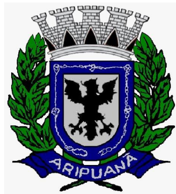
LOGO - BRASÃO DO MUNICÍPIO

*O custo estimado total da contratação é de R$ 1.858.424,40 (um milhão, oitocentos e cinquenta e oito mil, quatrocentos e vinte e quatro reais e quarenta centavos) .